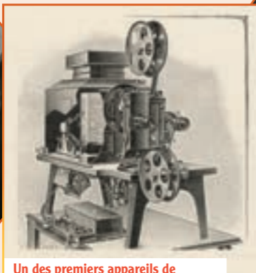
Un des premiers appareils de projection, produit par Léon Gaumont